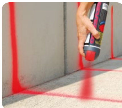
Pintura para marcaje y señalización