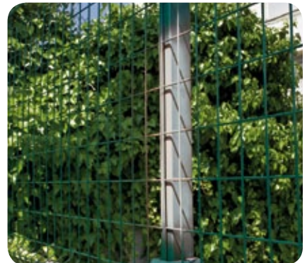
Imprimación antioxidante gris