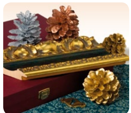
Pintura efectos metálicos