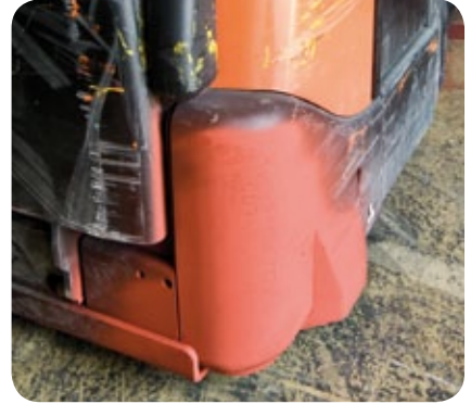
Imprimación antioxidante roja