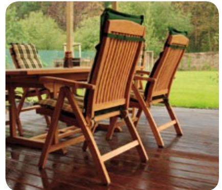
Aceite de Teca