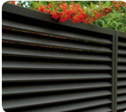
Esmalte anticorrosivo forja